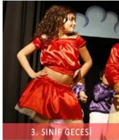
3. SINIF GECESİ

Ekin ailemiz 12 Ocak 2009 tarihinde, ilk karikatür festivalini gerçekleştirdi.