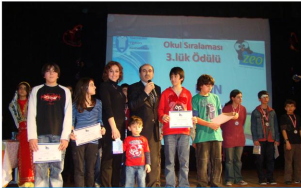
ZEO İZMİR 3.SÜ