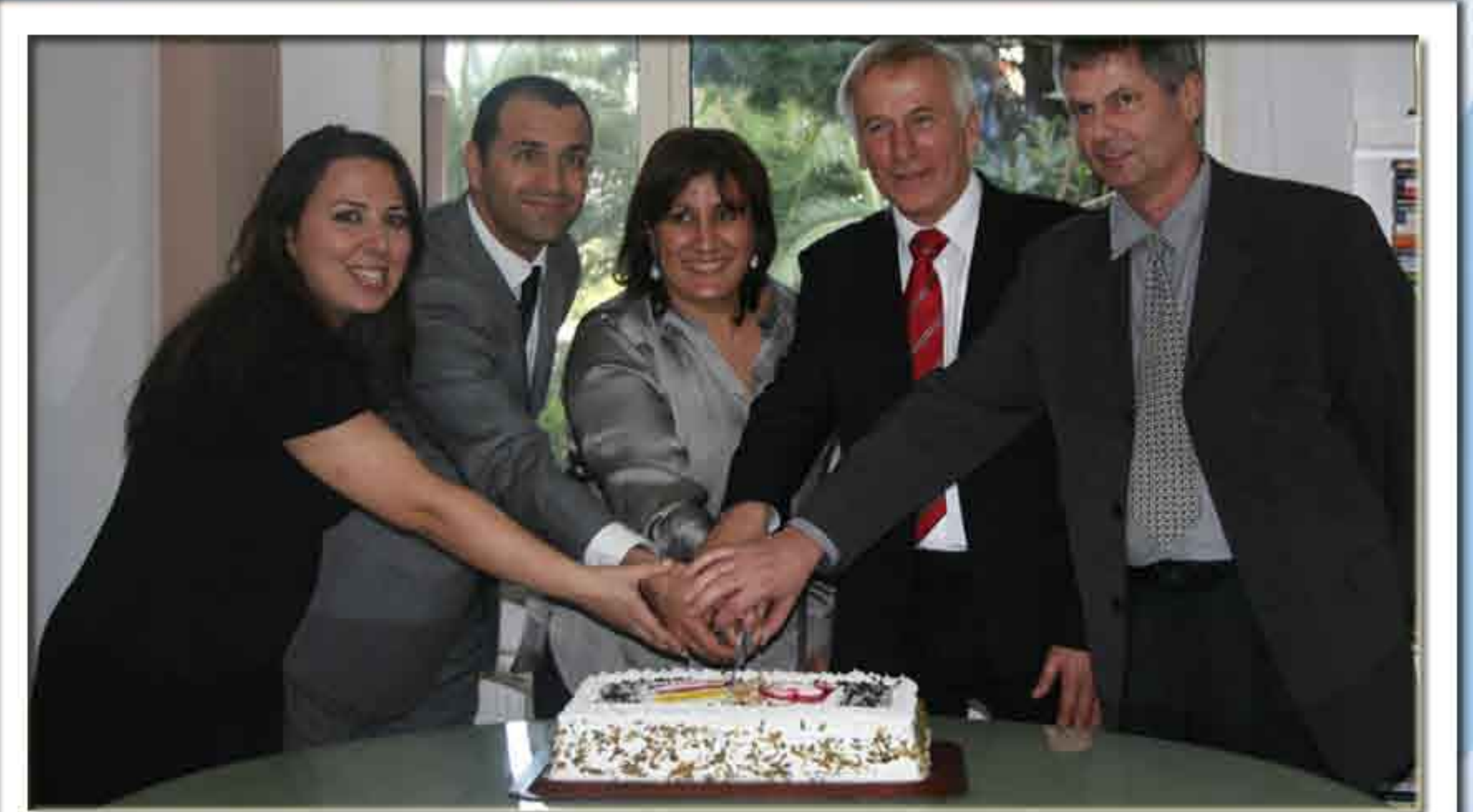
ALMANYA'DAKİ KARDEŞ OKULUMUZ RESMİLEŞTİ